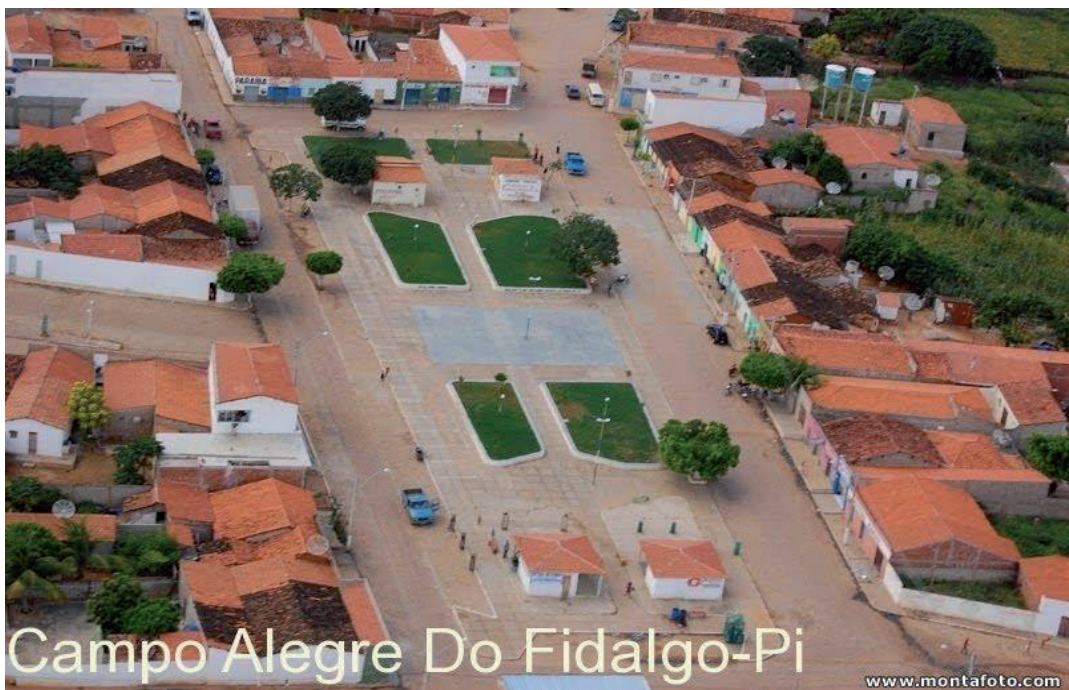
Campo Alegre Do Fidalgo-Pi